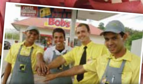
Equipe do posto Washington Luis 3 trabalhou para que tudo ocorresse bem no Carnaval