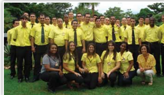
Assistentes e coordenadores participam do treinamento Líderes comunicadores

“Foi um dos melhores treinamentos que recebi na Forza. Foi objetivo e deixou bem claro para todos os participantes que, ao mudarmos de cargo, muitas vezes erramos por não ouvir a opinião do outro, seja de um frentista ou de outra pessoa.”