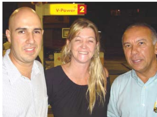
Diretoria da Rede Forza