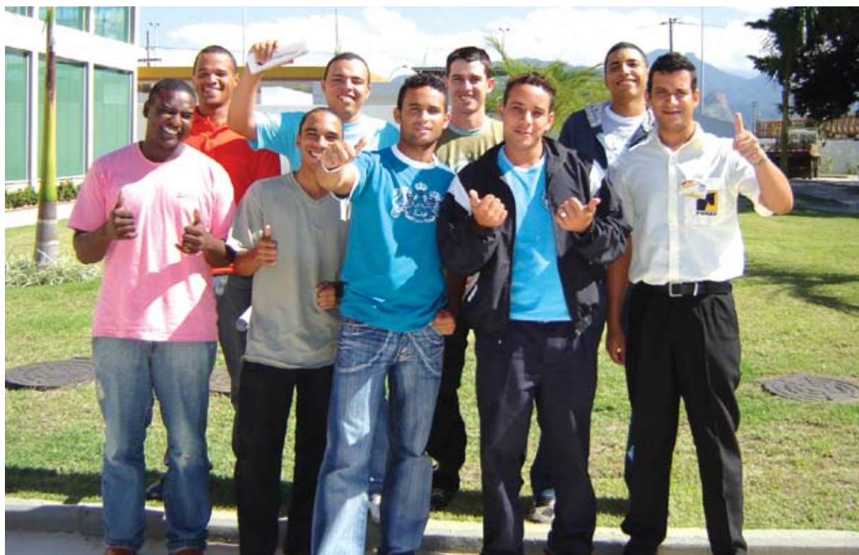
Os participantes da turma de maio – Treinamento Frentista Aditivado

Só este ano, oito turmas de frentistas frequentaram o treinamento "Frentista Aditivado" - um programa de qualificação comercial voltado para vendas e atendimento ao cliente, que é o primeiro treinamento na função.