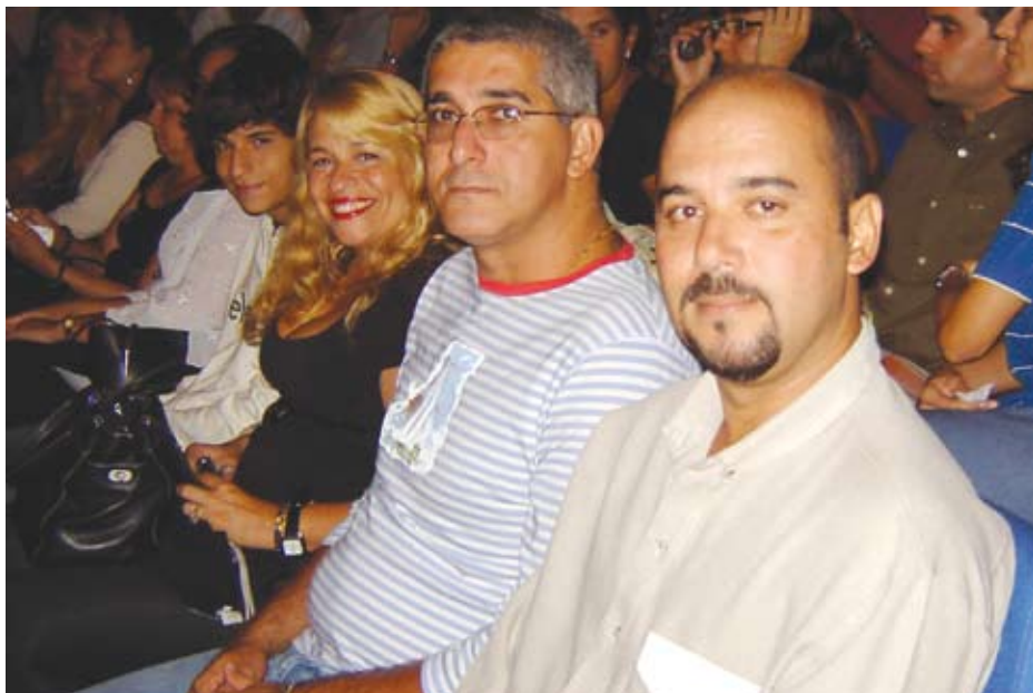
Platéia do Roupa Nova

Já no dia 9 de maio, o cantor Flávio Venturini embalou a platéia com as músicas do seu novo álbum “Canção sem fim”, no Rio Scenarium, Lapa. Aliás, está aí uma boa dica de presente para o Dia dos Namorados. O repertório traz 12 faixas com o melhor do estilo do cantor, incluindo “Amor pra Sempre”, “Melhores Dias de um Verão” e “Quanto Mais Teus Olhos Calam”, são alguns dos destaques. Um CD que não pode faltar em sua coleção!