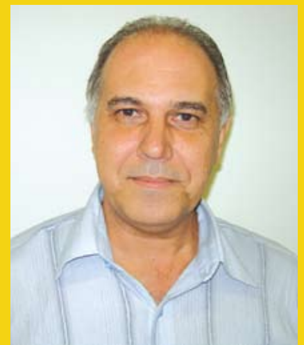
Por Roberto Rodrigues - Gemec

As lojas de conveniência "Tutta L'ora", destacam-se principalmente porque oferece um serviço destinado exclusivamente para atender às necessidades dos nossos clientes, com variedade e qualidade dos produtos, facilidade de estacionamento, limpeza, rapidez e simpatia no atendimento.